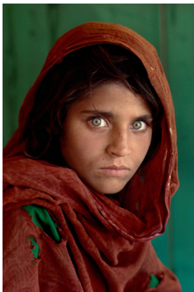
© Steve Mccurry - Afghan Girl

කුමන යථාර්ථයක්ද? විතැනදීම ගත් තව ජායාරූපයක් මෙහි දැක්වේ.