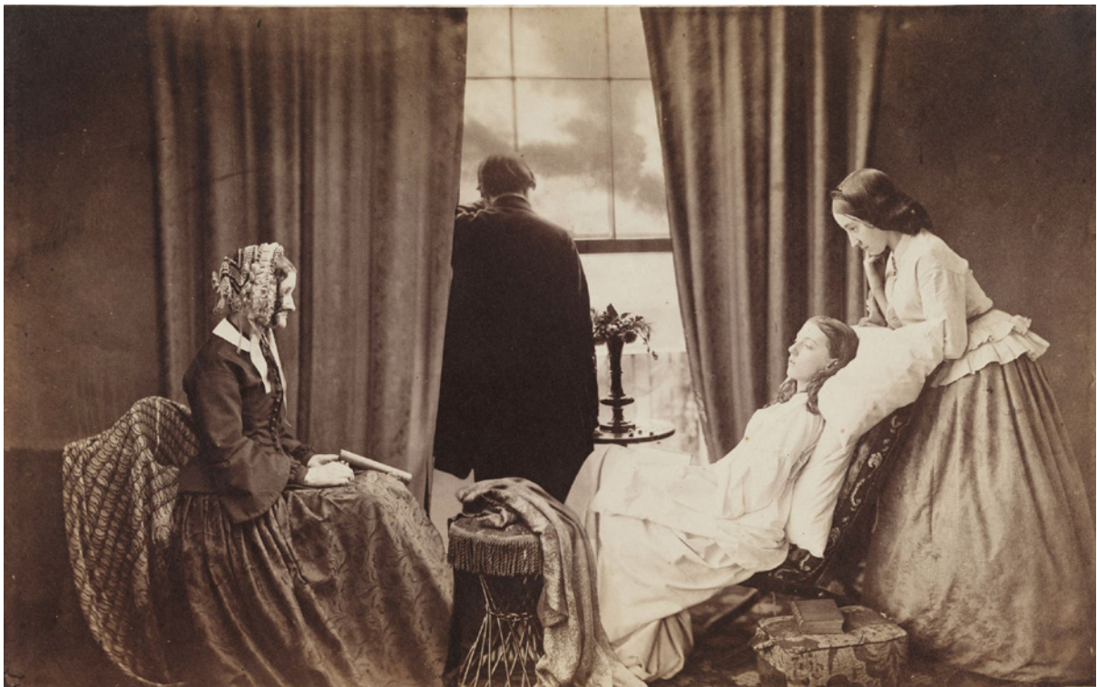
© Henry Peach Robinson - Fading Away

රොබින්සන්ගේ මෙම ඡායාරූපය හැඳින්වීමේදී හා විවේචනය කිරීමේදී Montage යන වදන භාවිත කිරීමෙන් ගම්‍ය වන්නේ, ඊට පෙරද, ඡායාරූප එක්කර තනි ඡායාරූප නිර්මාණය කර ඇති බවයි.