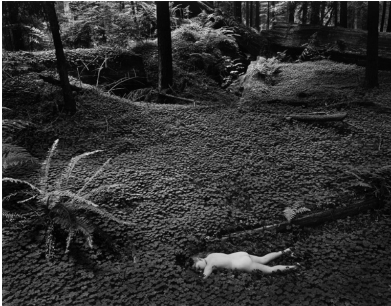
© Wynn Bullock - Child in Forest (Family of Man Exhibition)

විඩ්විඩ් ස්ටීකන් සංවිධානය කළ Family of Man ඡායාරූප ප්‍රදර්ශනයේ පළමු ඡායාරූපය ගනු ලබන්නේ ඇමරිකානු ඡායාරූප ශිල්පී Wynn Bullock විසිනි. ඒ ස්ටීකන්ගේ ආරාධනයකට අනුවය.