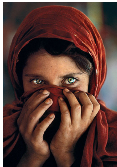
© Steve Mccurry - Afghan Girl Series