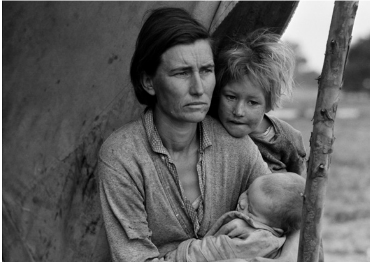
© Dorothea Lange - Migrant Mother Series

ඩොරතිසා ජායාරූප ගැන කරන පැහැදිලි කිරීමේදී සඳහන් නොකළද, ප්‍රසිද්ධියට පත් ජායාරූපය හා පසුව නමුදු ජායාරූප සැසඳීමේදී ජායාරූප ගැනීමට පෙර ඇස කළ සැකැස්ම වටහා ගැනීමට අපහසු නොවේ. කැමරාවට මුහුණ දෙන්නට ආශාකරන දරුවන් වෙනුවට ඇය සකස්කර ගත්තේ කැමරාවට මුහුණ සඟවා ගත් දරුවන්ය. මුල් ජායාරූපවලදී මුහුණට අත තබා නොගත, අම්මාගේ ස්වභාවික ඉරියව්ව වෙනුවට, ඩොරතිසා අවසාන ජායාරූපය සඳහා ඇගේ මුහුණට අත තබා ගැනීමට සලස්වයි. මුල් ජායාරූපවල නොසිටී තව දරුවෙකු අවසාන ජායාරූපය සඳහා යොදා ගනී.